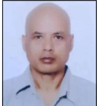
— शिशिल चित्रकार —

शक्ति पृथकीकरणका सिद्धान्त जतिसुकै फलाके पनि कार्यपालिका, व्यवस्थापिका, न्यायपालिकाबीचको अन्तरद्वन्द्वलाई सही वा गलत कसरी लिन सकिन्छ? व्यवस्थापिकाको आधारमा सृजित हुने कार्यपालिकाले व्यवस्थापिकातर्फ कतिको उतरदायित्व र जिम्मेवारी बहन गरेको छ? जनतालाई सर्वोपरि ठानी जनताको सेवाका मूल आधारमा